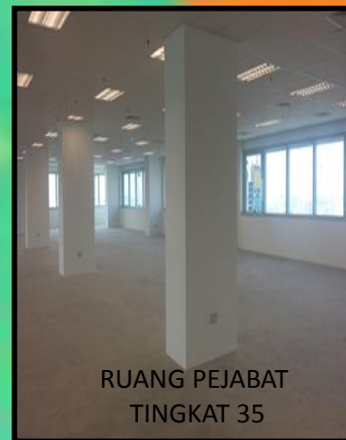
RUANG PEJABAT TINGKAT 35