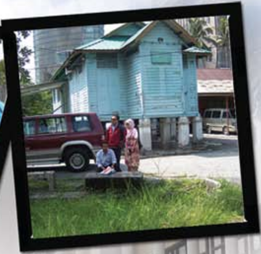
Lawatan tapak bagi cadangan pelepasan tanah di atas Lot 39 dan Lot 160 oleh Unit Pembangunan Hartanah