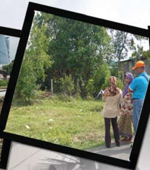
Lawatan tapak bagi tujuan kelulusan sewa di Rantau Panjang oleh Unit Pengurusan Hartanah