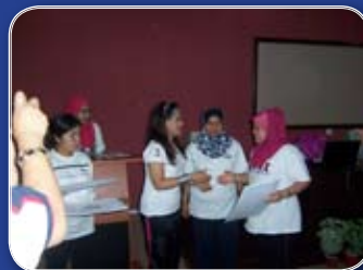
Wakil PAK menerima sijil penyertaan daripada wakil Jabatan Laut Semenanjung Malaysia. selepas berakhirnya Bengkel Keterampilan dan Kecantikan.