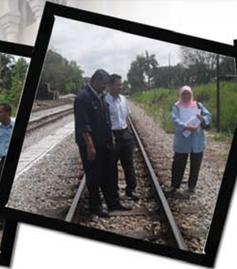
Lawatan tapak untuk penyewaan berhampiran stesen Bahau oleh Unit Pengurusan Hartanah