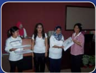
Wakil DCA menerima sijil penyertaan daripada wakil Jabatan Laut Semenanjung Malaysia selepas berakhirnya Bengkel Keterampilan dan Kecantikan.

Akhir kata daripada saya, jadikanlah persatuan ini sebagai "platform" untuk membantu menaikkan imej PAK. Sekian terima kasih.