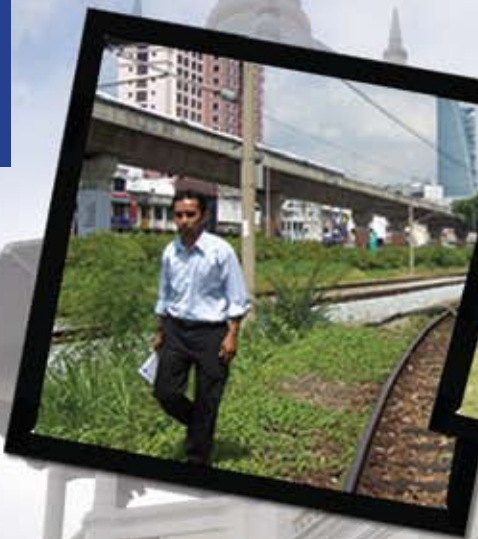
Lawatan tapak bagi cadangan pelepasan tanah di atas Lot 39 dan Lot 160 oleh Unit Pembangunan Hartanah