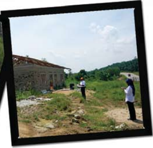
Lawatan tapak bagi tujuan pengesahan bangunan di Kg Dato Shariff Ahmad, Kuala Krau, Pahang oleh Unit Pengurusan Hartanah