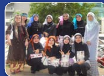
Para peserta Puspanita PAK yang menyertai Pertandingan Poco-Poco dan Nyanyian Solo memberikan pose menarik selepas acara penyampaian hadiah.