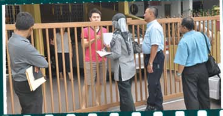
Penyerahan notis di Kepong oleh Unit Pengurusan Hartanah