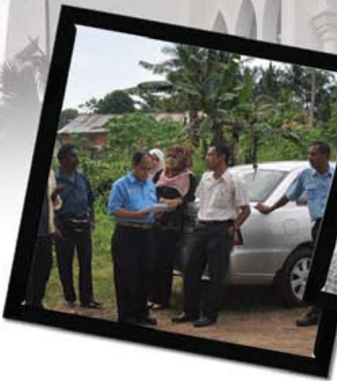
Lawatan tapak penyewaan di Mukim Rawang oleh Unit Pengurusan Hartanah